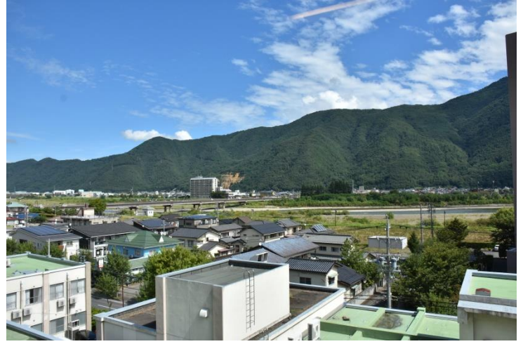
左) 南側の居室からの眺め。